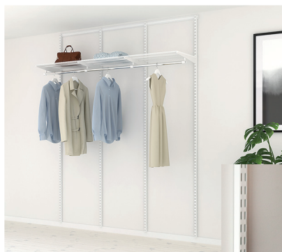
Basinredning med Bärlist, hängskena, trådhylla och klädstång.

Specialprodukter som utdragbart koställ eller slips- och bälteshängare får alla dina prylar en dedikerad plats, du får bra överblick och utnyttjar ytan optimalt.